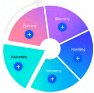
Das Phasenmodell nach Tuckman